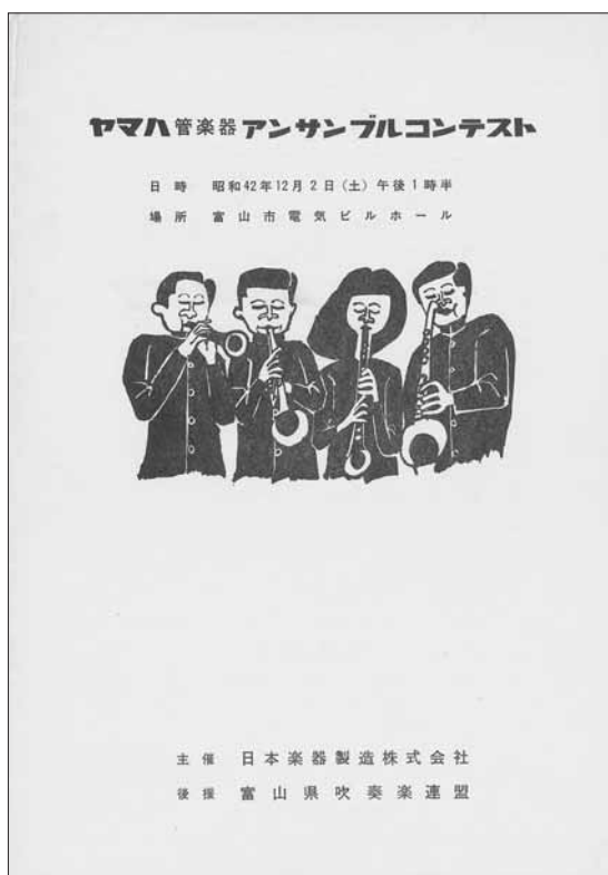
※このプログラムが第2回富山県アンサンブルコンテストプログラムとなる