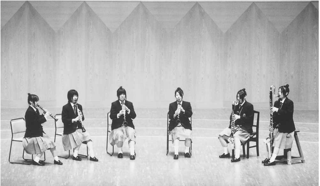
第30回全日本アンサンブルコンテスト高校の部 2007年（平成19年）3月21日（祝）横浜みなとみらいホール 富山県立高岡商業高等学校 クラリネット六重奏

※ 高岡商業高校は第28回～30回全日本アンサンブルコンテストに3年連続出場。通算18回、21チームが出場。