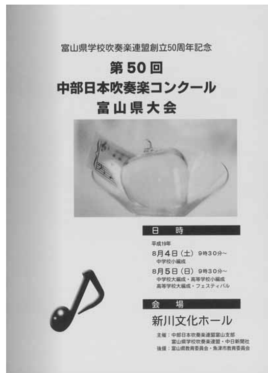
第50回大会プログラム