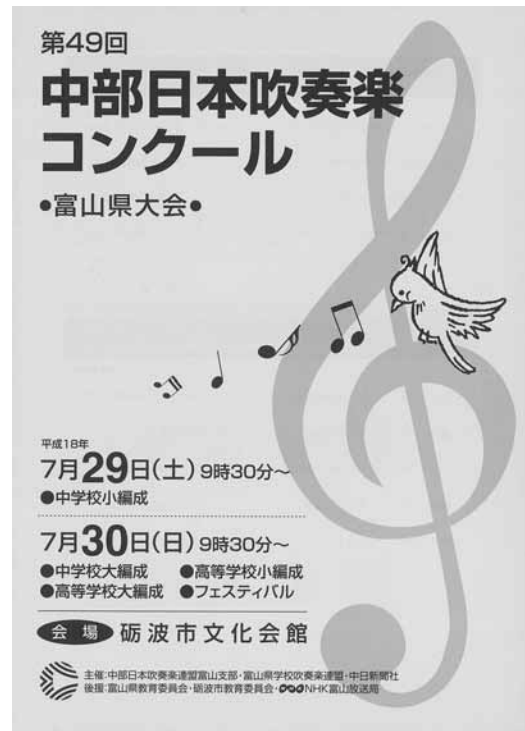
第49回大会プログラム