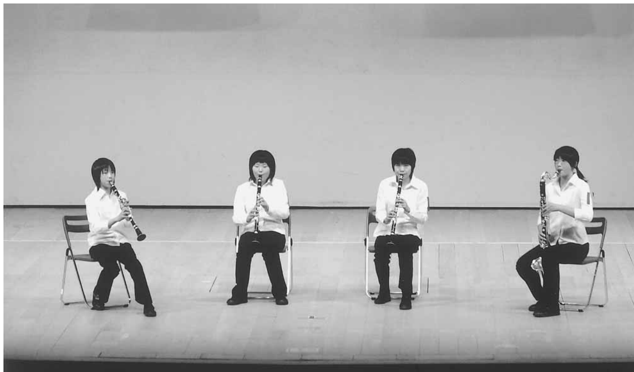
第29回全日本アンサンブルコンテスト 2006年(平成18年)3月21日(祝)岩手県民会館 氷見市立南部中学校クラリネット四重奏 初出場