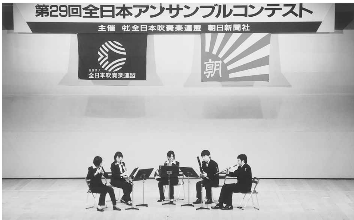
第29回全日本アンサンブルコンテスト 2006年(平成18年)3月21日(祝)岩手県民会館 富山大学吹奏楽団木管五重奏

※ 富山大学吹奏楽団は第25回~第27回全日本アンサンブルコンテストに3年連続で出場。通算4回、4チームが出場。