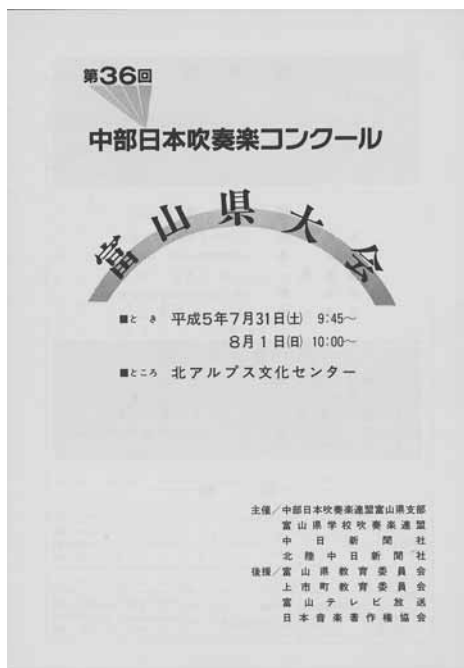
第36回大会プログラム